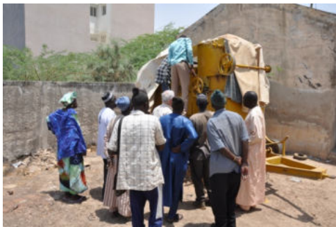
Formation à l'entretien de la batteuse remisée