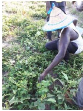
récolte de l'arachide