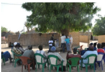
Mouhamed, l'animateur de l'Agroprov et Nadine préparent et animent les réunions en Avril 2018