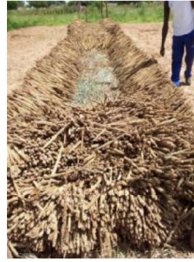
stockage du mil avant battage