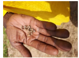
Graine de mil